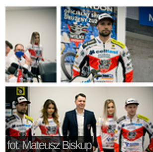
Grupa Nice rozszerza patronat nad Wilkami Krosno

Strona główna | Oferta | Publikacje | Sieć sprzedaży - kontakt | Praca